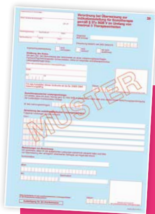
Formular 28 zur Verordnung bei Über- weisung zur Indikations- stellung für Soziotherapie

Ärzte und Psychotherapeuten benötigen für die Verordnung von Soziotherapie eine Genehmigung der Kassenärztlichen Vereinigung (KV). Dafür stellen sie bei ihrer KV einen „Antrag auf Abrechnungsgenehmigung zur Verordnung von Soziotherapie“. Darauf müssen sie unter anderem Einrichtungen angeben, mit denen sie kooperieren (gemeindepsychiatrischer Verbund oder vergleichbare Versorgungsstrukturen). Erst wenn die Genehmigung der KV vorliegt, darf Soziotherapie verordnet und zulasten der gesetzlichen Krankenversicherung abgerechnet werden.